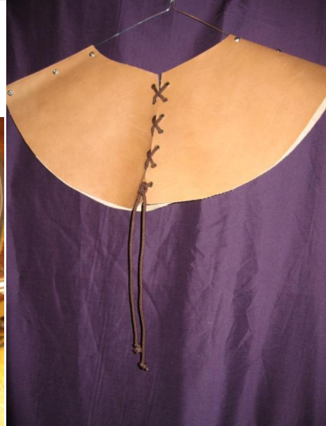
CRESPINA Y GORROS DE CABALLERO